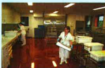
Zone de lavage avec les 3 laveurs désinfecteurs