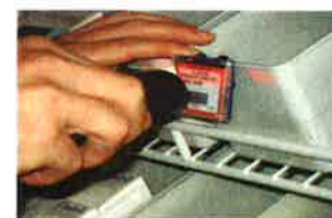
Scan de l'étiquette Code-barre

Chaque acteur est centré sur son cœur de métier