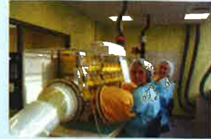
Unité de reconstitution des cytotostatiques