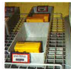
Système plein -vide