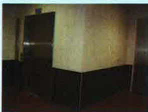
Monte charge reliant les blocs opératoires à la zone de lavage