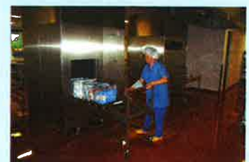
Zone de déchargement des autoclaves