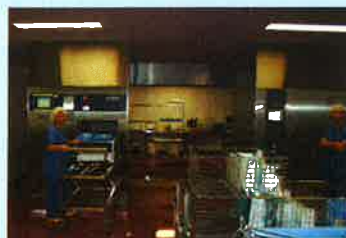
Zone de reconditionnement avec les 3 autoclaves